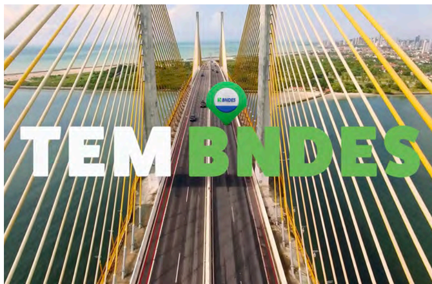
A campanha "Tem BNDES" teve o objetivo de aumentar o conhecimento sobre o Banco

No total, nossas ações publicitárias representaram investimento de cerca de R$ 40 milhões em 2018. Esse número representa 0,26% de nossa receita operacional bruta (ROB) em 2017.