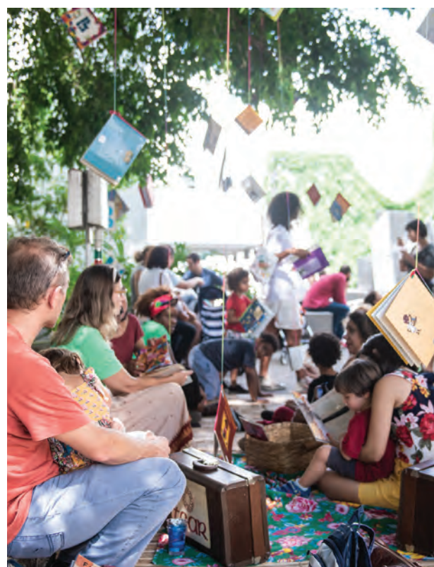
Patrocínamos a Flup, festa literária brasileira destinada às periferias do Rio de Janeiro

Com os objetivos principais de difundir conhecimentos, gerar negócios e fomentar nossos segmentos de atuação, patrocínamos 47 projetos de caráter técnico em 2018, como congressos, conferências e feiras. Em 2018, selecionamos projetos de temáticas alinhadas a nossas novas orientações estratégicas, destacando-se os segmentos de inovação e MPMEs. O total de investimento foi de R$ 5.880.901,25.