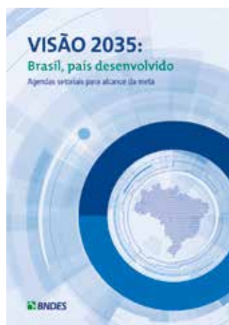
O livro Visão 2035: Brasil país desenvolvido traz análises sobre 17 setores da economia brasileira

Em 2018, além de nossos periódicos tradicionais, como a Revista do BNDES e o BNDES Setorial , lançamos a publicação Agendas setoriais para alcance da meta , da série Visão 2035: Brasil país desenvolvido , que combina análise sobre 17 setores da economia brasileira com técnicas de planejamento estratégico por meio de cenários, para construir uma agenda de desenvolvimento para o país no horizonte 2018-2035.